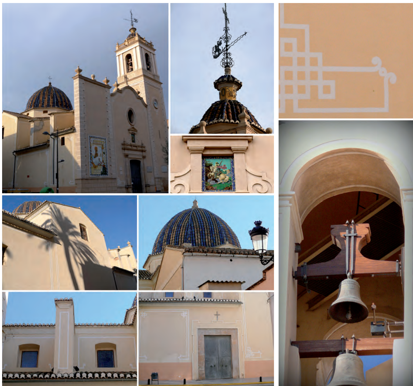
Fotografies de Vicent Pascual, Paiporta 2015.